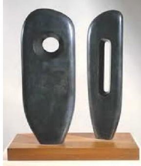
بابريارا هيپورث: اشكال مجردة، خشب ملون، ١٩٨٣.

التحرر الكامل من النموذج، واختفت كل إشارة الى الموضوعات الطبيعية، واصبحت العناوين على سبيل المثال: "اشكال"، "دوائر"، "اجواء"، "مخروطات" بدلا من "الام والطفل" الخ. ٣٧ وهكذا فان الحديث عن التجريد كاتجاه فني قد لا ينتهى، وقد حاول الباحث قدر استطاعته ان يقدم لهذا الاتجاه الفنى من اسباب لاختياره كموضوع للبحث، كذلك تفسير التجريد كمصطلح واصوله فى فنون التراث، وتطوره فى الفن الحديث، واخيرا اتجاهات التجريد فى النحت الحديث، وذلك تمهيدا لتناول التجريد فى النحت المصرى المعاصر.