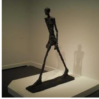
البرتو جياكوميتي : رجل يسير ، برونز ، ١٩٤٩ .